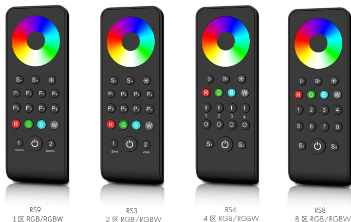
RS9 1区 RGB/RGBW